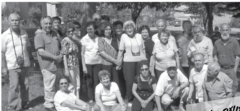
חברת הנוער - יסעור