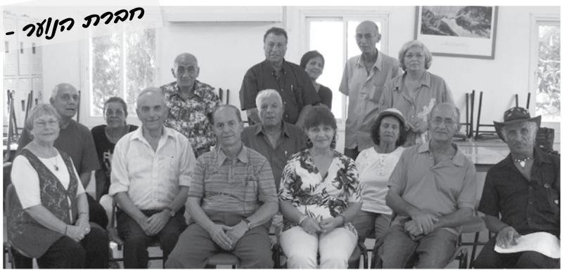
חברת הנוער - אלון

קבוצות ילדים ונערים, שקובצו במסגרת עליית הנוער והופנו להתחנך בקיבוץ. בשנים הראשונות היו אלה ילדים שהגיעו אחרי המלחמה, במקרים רבים ללא הורים. בקיבוץ הם אומצו על ידי משפחות של חברי הקיבוץ. (קשרים שבחלקם נמשכים עד היום). לכפר מנחם הגיעו ילדים ונערים מפולין, מהונגריה, מרומניה, מבלגריה, מפרס, מעיראק, מחבר העמים וגם ישראלים. חלק מחברות הנוער עברו והשלימו קיבוצים אחרים (מייסדי קיבוץ סער, רשפים, להב ועוד) חברת הנוער יסעור יועדה להשלים את כפר מנחם, ורבים מחבריה חיים פה עד היום. חברות הנוער שהתחנכו בכפר מנחם: חברת הנוער הפולנית והרומנית, שלהבת, מבקיעים, יסעור, עמל, זית, אלון, חצב, ערבה ונעל"ה. בקיבוץ חיים עד היום בוגרי חברות נוער, שנישאו ובנו פה את ביתם.